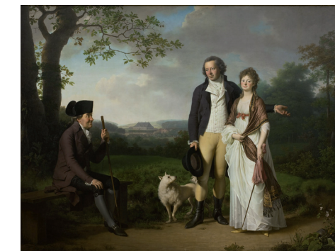
Jens Juel: Det rybergske Familiebillede.